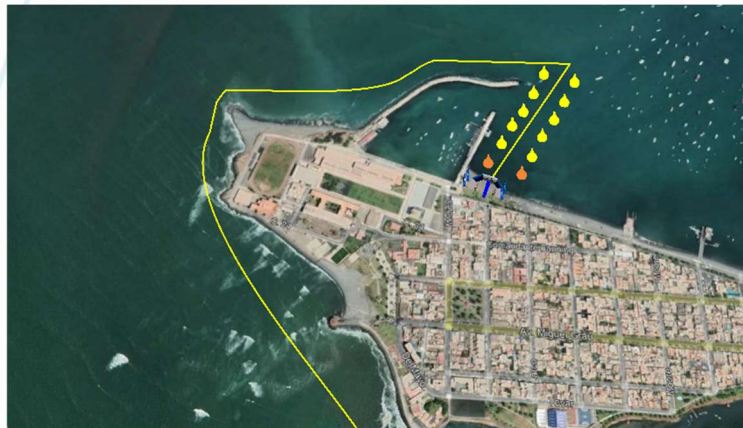
Llegada: Fin de la travesía a playa Cantolao- Paso del Camotal.